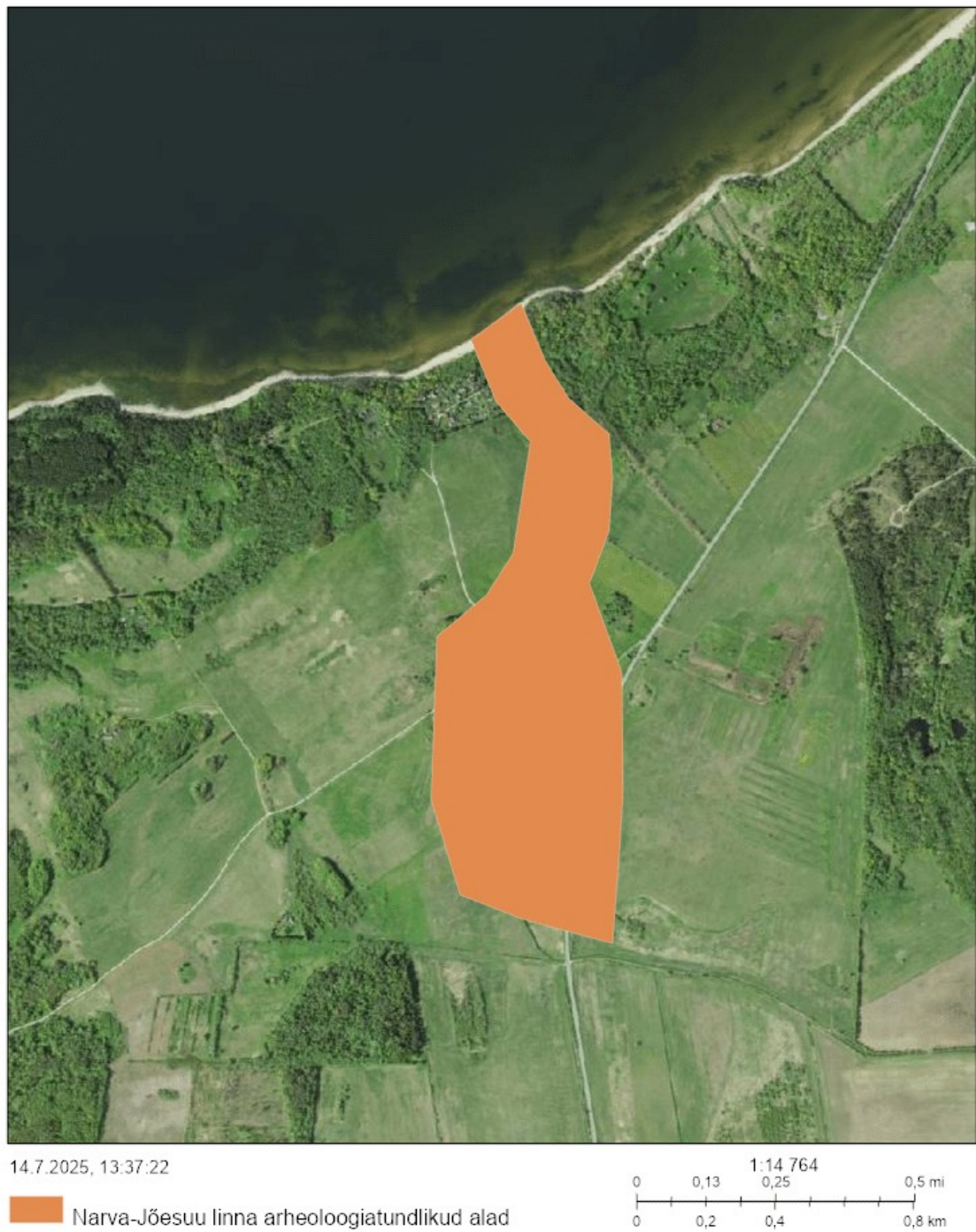
Kaart 3. Udria arheoloogiatundlik ala on tähistanud oranžiga. Väljavõte Muinsuskaitseameti kaardiportaalist.